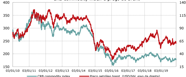
CRB commodity index e preço do brent