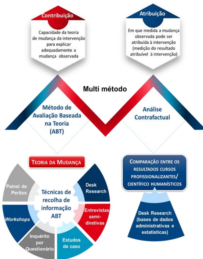
Figura 1: Abordagem Metodológica

Assim, a partir do capital teórico acumulado sobre as matérias em avaliação e, sobretudo, sobre o tipo de fatores-críticos condicionantes dos resultados da tipologia de operações em avaliação, é mostrado como as problemáticas das três dimensões centrais da Avaliação – sucesso escolar e educativo, AEP e empregabilidade – surgem relacionadas e implicadas entre si, ou seja: a retenção escolar, principal mecanismo de produção de insucesso, que é socialmente seletiva e um problema endémico do sistema, constitui, na realidade, um dos principais preditores de abandono escolar precoce que, por seu turno (e juntamente com a sobrevalorização da conclusão do ensino secundário através das vias científico-humanísticas), contribui para uma maior exposição ao desemprego, e maior probabilidade de integração pouco qualificada no mercado de trabalho. A tendência ainda muito presente de rápida absorção das baixas qualificações pelo mercado de trabalho, acompanhada de uma maior desvalorização da escolarização, ou do afastamento face ao contexto e cultura escolar, explicam a incidência do AEP em alguns grupos da população escolar, o que, por sua vez, tem vindo a contribuir para o incumprimento dos 12 anos escolaridade obrigatória, mais evidente em alguns segmentos da população estudantil, em algumas escolas e contextos pautados por maiores índices de seletividade e de insucesso escolar reiterado.